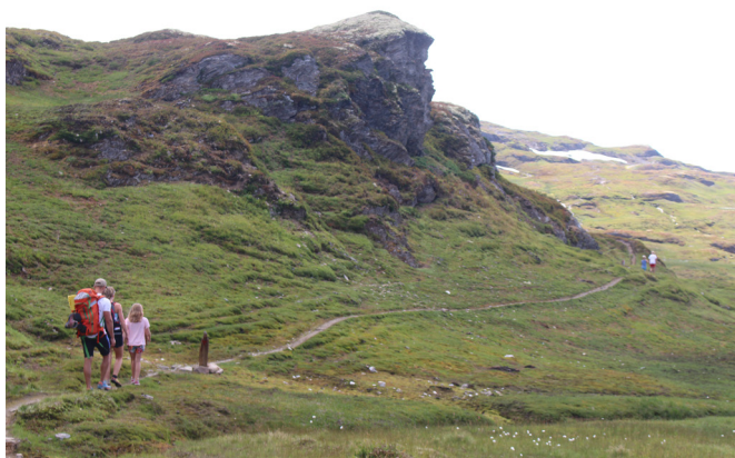
God sti fører over fjellet til Engjadalen og Gaupne.