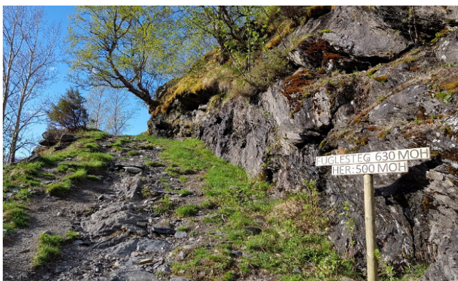
Nye skilt med markering for kvar hundre høgdemeter vart godt mottekne i fjor.