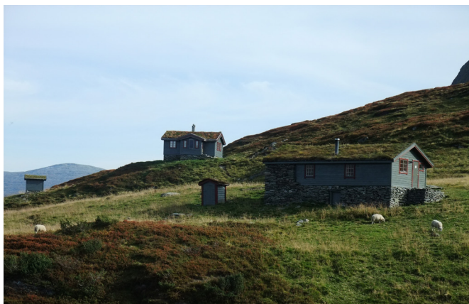
Slik vonar me det ser ut 19. juli, då Vigdalsdilten går i år.