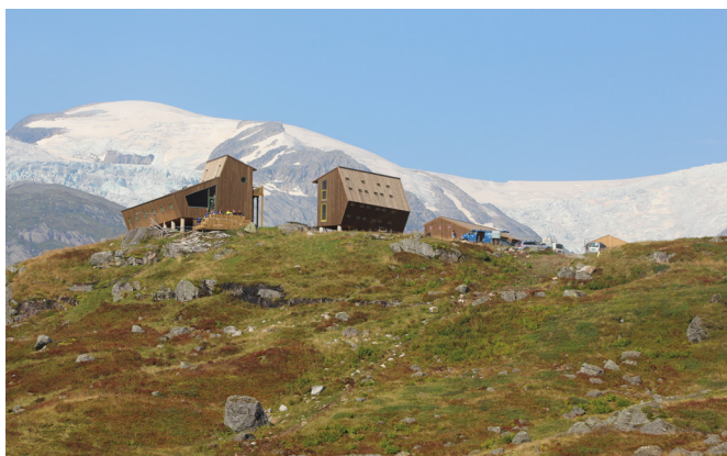
Første byggesteg ferdig i slutten av august. Når startar neste etappe?