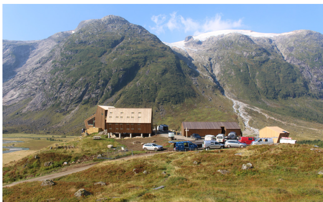
Tungestølen 26. august – berre fire månader seinare!