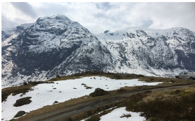
Tungestølen 26. april 2019.

Me vel å presentera bygningar og feiring med ein biletkavalkade, og ser fram til stor trafikk til sommaren, slik det var dei få vekene me hadde ope hausten 2020!