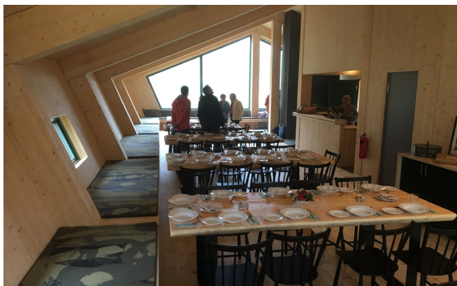
Borda dekket for rømmegrøt og spekemat til innbedne gjester.