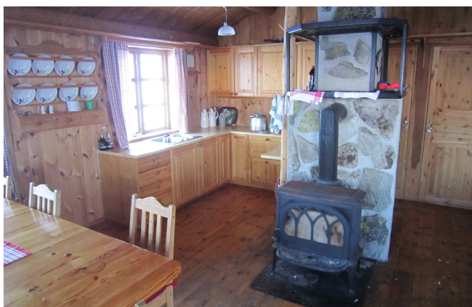
Eit velutstyrt kjøkken finn du i begge hyttene.