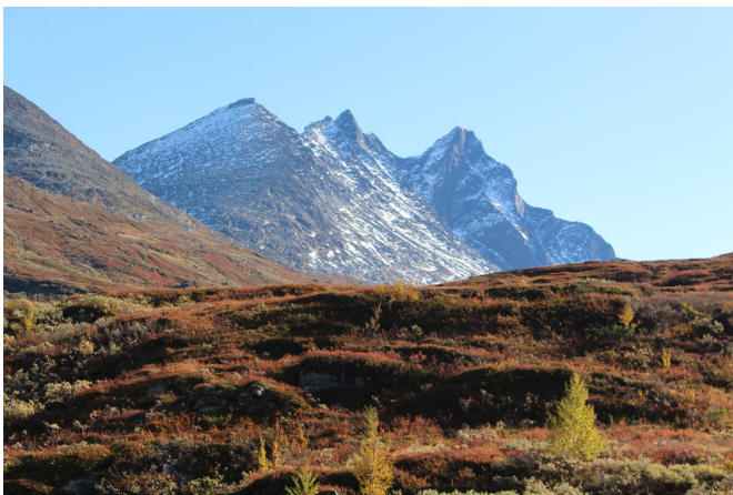
Den høgste av toppane i den nye Topptrimmen er den til venstre – Nordlege Skagastølstind.

Turlaget opplever ein eineståande vilje til dugnadsinnsats, og dette gjer det mogeleg å driva og føra tilsyn med hyttene våre og å arrangera turar og skipa til kulturelle aktivitetar utan at kostnadene blir for høge. Dessutan har laget ein svært god hovudsponsor i Luster Sparebank.