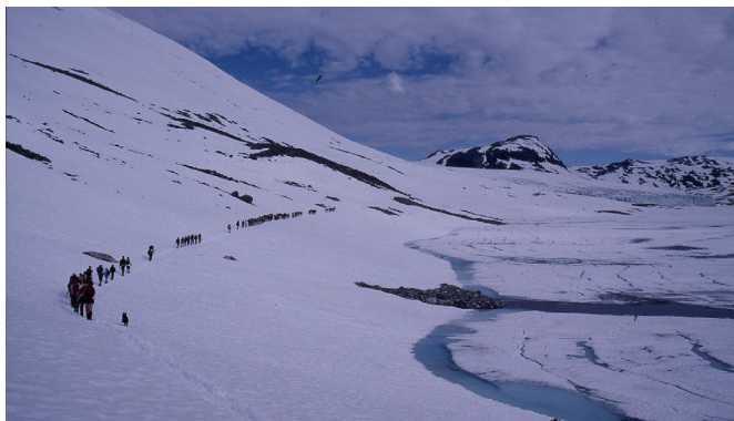
Langt følgje langs Austdalsvatnet. Her startar turen over Jostedalsbreen i år.

Dei fleste vil bruka rundt halvannan time på vegen opp. Nyt turen og utsynet!