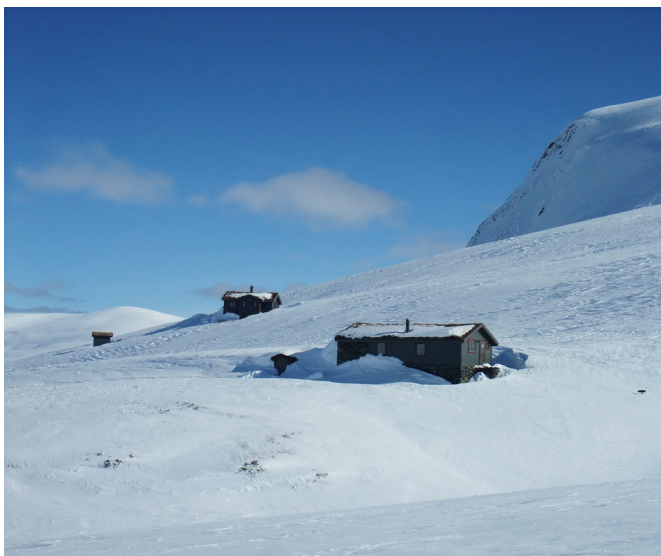
To store og fine hytter står klare for gjester.

om leigerett på det gamle stølhuset som hadde stått der. Selet hadde ikkje vore i bruk etter om lag år 1900, så det meste var til nedfalls. Etter at turlaget fekk eit godt overskot på den første boka si – «Vandring i Lustrafjell» - kunne ein byrja å tenkja på oppattbygging på Fivla. Somrane 1982 og 1983 gjekk med til bygging, både med legehjelp og med stor dugnadsinnsats. Seinare har det vore jamnt godt vedlikehald på begge husa, og turlaget kan i 2020 presentera eit flott anlegg på denne gamle stølen, som i si tid vart brukt av gardar på Høyheim og Øvre Nes.