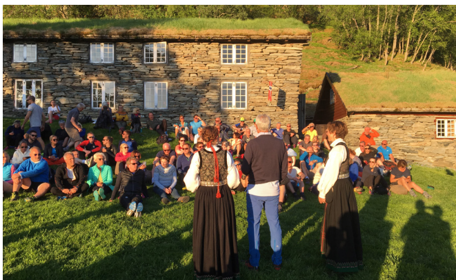
Ein av dei mange festdagane som har vore i Fuglesteg etter opninga i 2005.