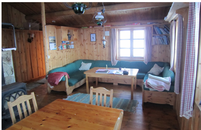
Sofakroken i nyehytta er romsleg.