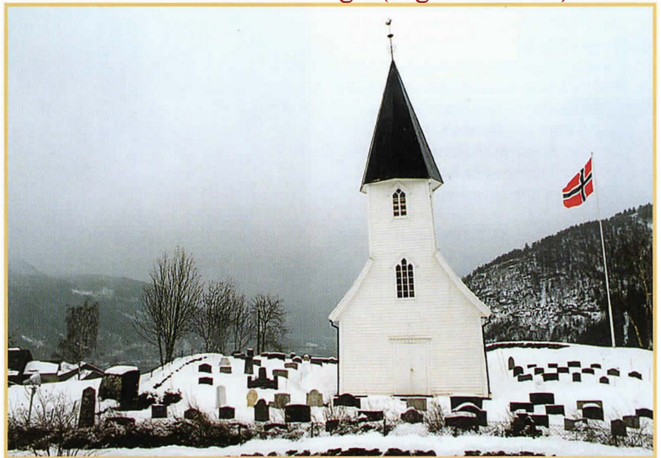
Den rette alderen veit vi ikkje sikkert, men Joranger kyrkje er truleg frå 1620-talet. Tårnspiriet er åttekanta og heller stort i høve til kyrkjebygget. Her slaggar dei til gudsteneste 1. juledag.