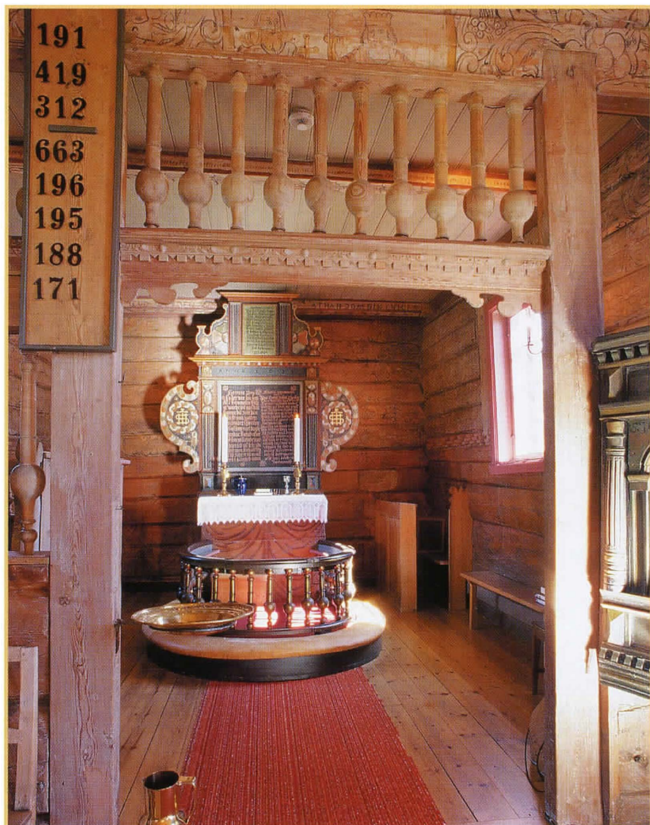
Altarringen er uwanleg liten, og er ein av fleire fine detaljar i koret. Altartavla er datert til rundt 1620. T.h. skimtar vi den gamle klokkekarstolen.

Her les vi at gudshuset vart tjørebreidd same året (1686), og at det draup frå sør-sida i koret. Innvendig var det naudsynt med reparasjonar av kyrkjestolane på kvinnesida. Vidare vart det påpeika at ungdommen måtte få eigne benker langs veggene, og at der var trong for to nye hengsler på døra inn til fontehuset (der