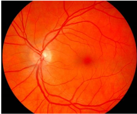
Bildet over: normal øyebunn Bildet under: retinopati