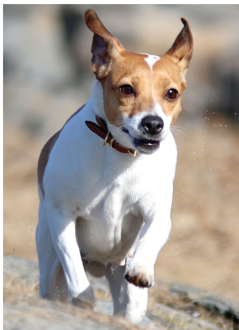
DANSK-SVENSK GÅRDSHUND.

4.1. Bare funksjonelt, klinisk friske hunder skal brukes i avl. Hvis nære slektninger av en hund med en kjent eller antatt arvelig sykdom brukes i avl, bør den pares med en hund som kommer fra en familie med lav eller ingen forekomst av tilsvarende sykdom.