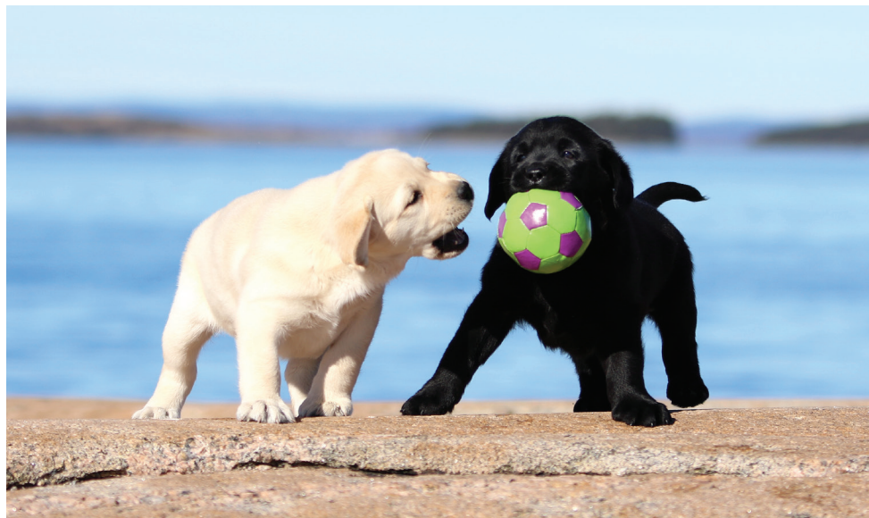
LABRADOR RETRIEVER.

omtales som rasepopulasjonen også bør inkludere populasjonen i de mest aktuelle samarbeidsland, for eksempel Norden.