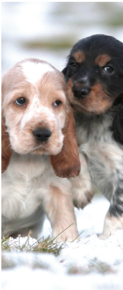
COCKER SPANIEL.

Reaksjonsmåter for brudd på grunnreglene er vedtatt av HS 11.11.2011.