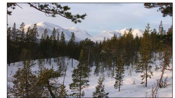
Utsikt fra nedre del av området mot "De blå fjella"