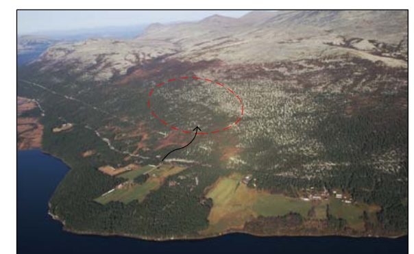
Flyfoto 1: Området sett sørfra med avkjøring fra rv 219