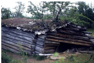
Midtliua med steinhelle

Midtslettet, et gammelt slåtteland som tilhørte Ekrom, var en gard som nå er sammenslått med Kirkebø. Slettet ligger i Gausdal Statsallmenning, innenfor grensa til de private skogteigene i Nedre Svatsum.