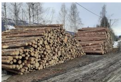
Tømmerlunner i Ulsrud

Sesongen starta med rydding og grusing etter tømmerhogst, tun og hus ble klargjort med vanntilkobling, planting og vårvask, traktor på plass.