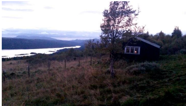
Septemberkveld på Ulsrudsætra

Gausdal Historielag takker for all velvilje og innsats!