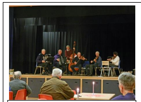
Gausdal Spelemannslag i aksjon.

Arrangert i samarbeid med Gausdal Spelemannslag i Forset Grendahus 23. november.