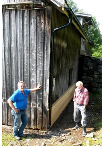
Ny brystning og takrenne på fjøs

Dugnader og gratisarbeid denne sesongen kom opp i 500 timer.