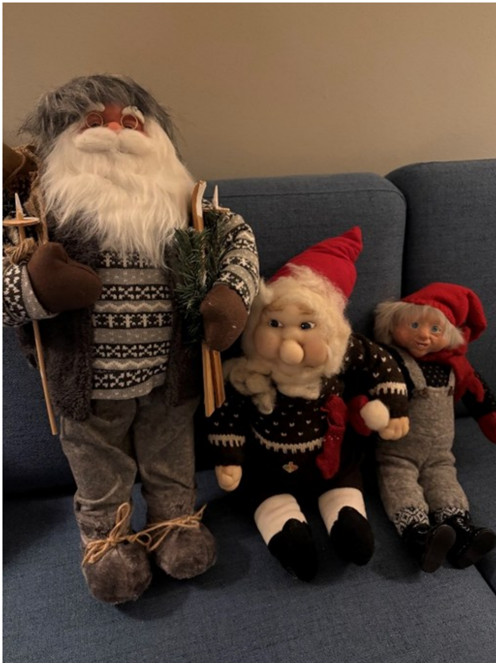
Bildet viser tre nissefigurer på rad. Fra venstre Jozias, i midten Marius og til høyre Cornelis.