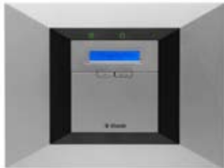
PowerMax Pro: 62 024 93

PowerMax Pro er toppmodellen av de trådløse alarmsentralene fra Visonic Ltd. Den har et nytt og moderende design med helt nye tekniske løsninger. Den har mulighet for innebygget GSM-sender, innebygget PowerLink kamerasystem og integrert strømforsyning. Sentralen har mulighet for flere områder, noe som gjør den svært anvendelig også i mer komplekse installasjoner. Systemet er avansert, men betjeningen kan enkelt gjøres via fjernkontroll eller trådløst tastatur. Sentralen har selvsagt norsk tekst og tale, den kan også opprette full toveis talekommunikasjon via telefonlinjen eller GSM-senderen. Systemet har en enestående immunitet mot falske alarmer og en avansert deteksjon av signalforstyrrelser (jamming). Den trådløse overføringen av signaler mellom hver enkelt detektor og sentralen foregår kryptert. Sentralen er også kontrollerbar via web (forutsetter PowerLink), SMS (forutsetter GSM-sender), mobiltelefon eller vanlig telefon. Den har 250 hendelser i loggen og mulighet for 2 backup-batteri for lengre backup-levetid. Installasjonen er vesentlig forenklet i forhold til tidligere modeller, og programmeringen gjøres lokalt eller via software på PC. Sentralen er godkjent etter EN50131-1, klasse 2