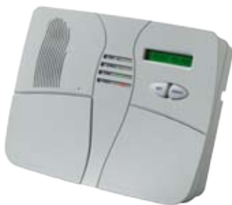
PowerMax Plus: 62 024 46

PowerMax Complete er det nyeste skuddet på stammen av PowerMax sentraler. Den har et nytt og moderende design med helt nye tekniske løsninger samtidig som den er et prisgunstig alternativ til storebroren PowerMax Pro. Den har mulighet for innebygget GSM-sender, og strømforsyningen er integrert. Betjeningen kan enkelt gjøres via fjernkontroll eller et trådløst tastatur. Sentralen har norsk tekst og tale, den kan også opprette full toveis talekommunikasjon via telefonlinjen eller GSM-senderen. Systemet har en enestående immunitet mot falske alarmer og en avansert deteksjon av signalforstyrrelser (jamming). Den trådløse overføringen av signaler mellom hver enkelt detektor og sentralen foregår kryptert. Sentralen er også kontrollerbar via web (forutsetter Broadband module), SMS (forutsetter GSM-sender), mobiltelefon eller vanlig telefon. Den har inntil 250 hendelser i loggen.