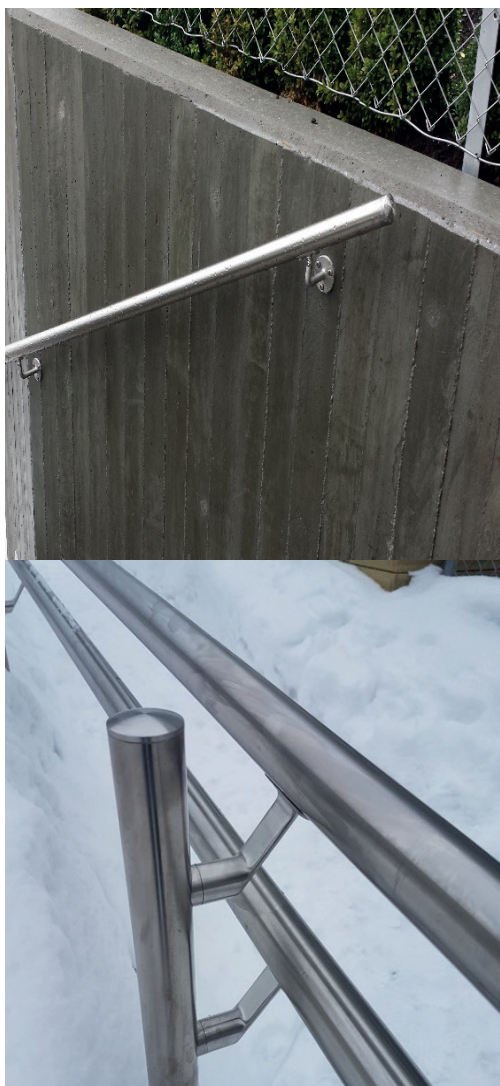
Enkel håndløpere Doble håndløpere