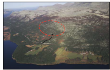
Flyfoto 1: Området sett sørfra med avkløring fra rv 219