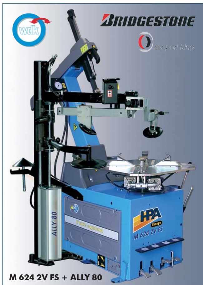
M 624 2V FS + ALLY 80

Grande capacità di bloccaggio e prestazioni superiori. Wide clamping range and top performances. Gran capacidad de bloqueo y altas prestaciones.