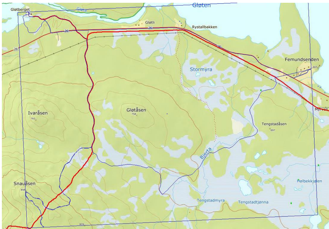
Oversikt 1: Blå strek oppkjørt løype fra Femundsenden, rød strek skiløype Kåre Olav Elgåen

Vi ber om at man igjen vurderer regulering av løype 10 litt lenger vest så vi får med det opprinnelige forlaget som Kåre Olav og ESF har fremmet tidligere.