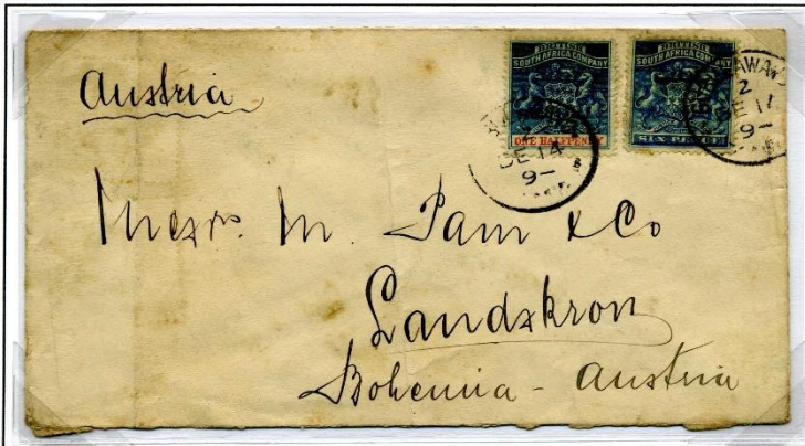
D1 State 2 (10.11.88) -(20.2.93) & (15.1.94) -(22.3.95) & (13.10.95) In 1894 used 9- for the year.