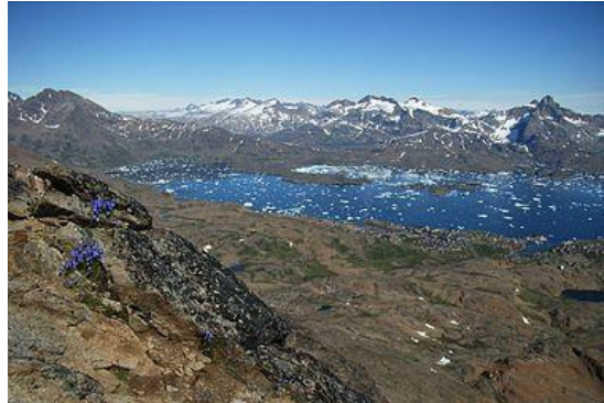
UTSIKT OVER TASIILAQ FRA SØMANDSFJELDET. 1

Tasiilaq (tidligere kalt Ammassalik , gammelgrønlandsk: Angmagssalik ) er den eneste byen, og administrativt sentrum i Ammassalik kommune , sydøst på Grønland . Navnet Ammassalik brukes i dag kun om kommunen, men opprinnelig ble navnet brukt om området rundt Kingak innerst i Angmagsalikfjorden, og kommer av det grønlandske ordet Angmagsak, som betyr lodde .