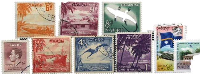
Over noen eksempler på frimerker fra Nauru

Og det sier jeg frimerker er enormt lærerikt Jeg hadde vel aldri satt meg ned for å lese om denne øya og folkene der dersom jeg ikke hadde kjøpt denne samlingen. Moralen må jo være at det er ikke alltid rikdom er til det gode. Fortsett å samle frimerker og begynn gjerne på et nytt land. Utvid horisonten