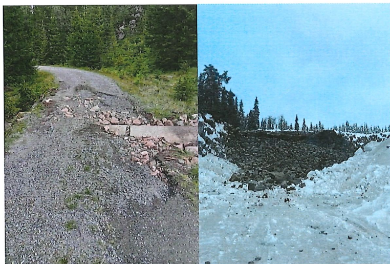
Skader etter «Hans» 8. august og fjellmasser klare for knusing til våren.

Vegen mot Fuglebakka er gruset. Stormen «Hans» forårsaket skader flere steder på almenningsvegene, som det er søkt erstatning for via Naturskadefondet. Det er i tillegg utført sporadisk vedlikehold av øvrig vegnett. Det er investert i en pent brukt dumperhenger da den gamle var for liten og begynte å bli slitt. Det er nå sprengt ut 7.000m 3 med fjell som skal knuses til våren og brukes som vedlikehold i årene fremover.