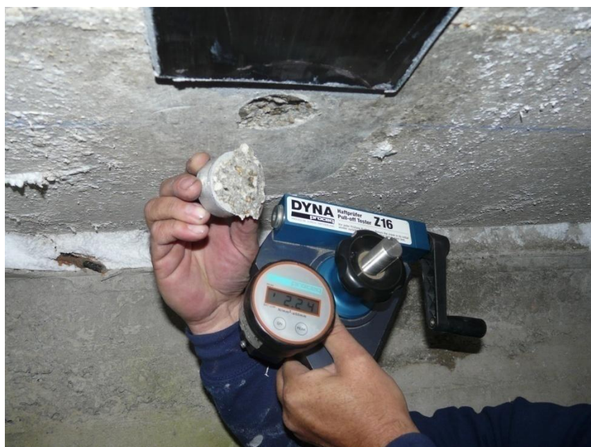
Bilde: Heftprøver av betongen.