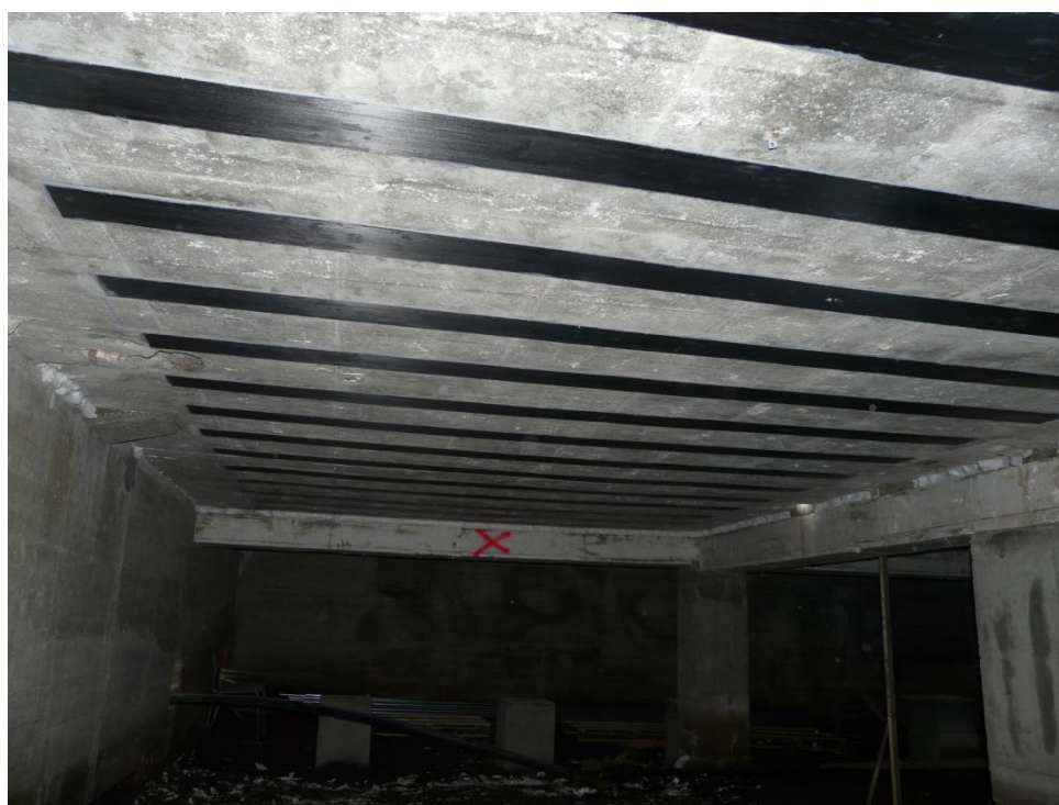
Bilde: Her blir det montert carbodor s1512 i krypkjeller.