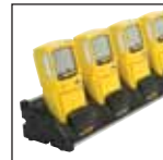
Ladeholder for flere enheter