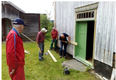
Snikkerlaget i Ulsrud i arbeid.

Tømmerhogst er utført og tre kyr har beita på sæterlykkja. Dugnadsarbeidet inne og ute har gått sin gang. Innendørs på kjøkkenet ble emaljert vedovn skifta ut med eldre svart støpejerns vedkomfyr.