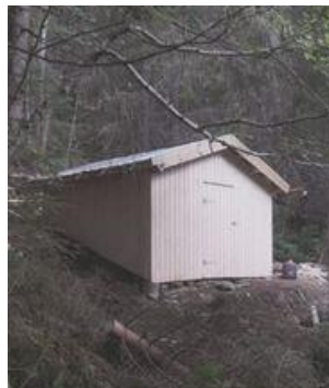
Det nye brønnhuset i Ulsrud.