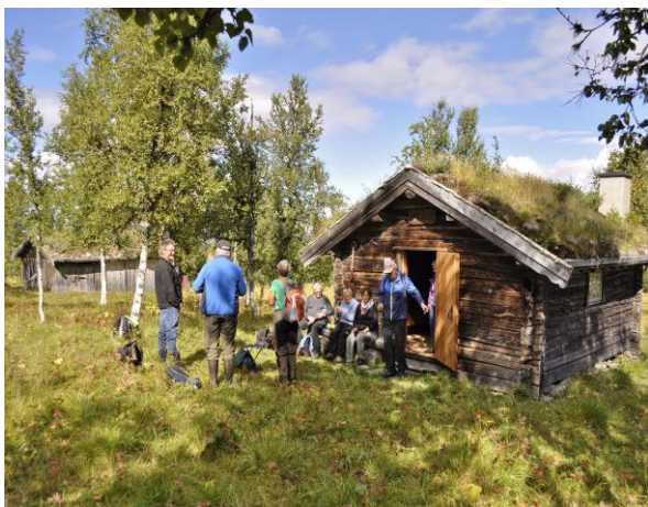
Fra markvandringa til Moslettua.