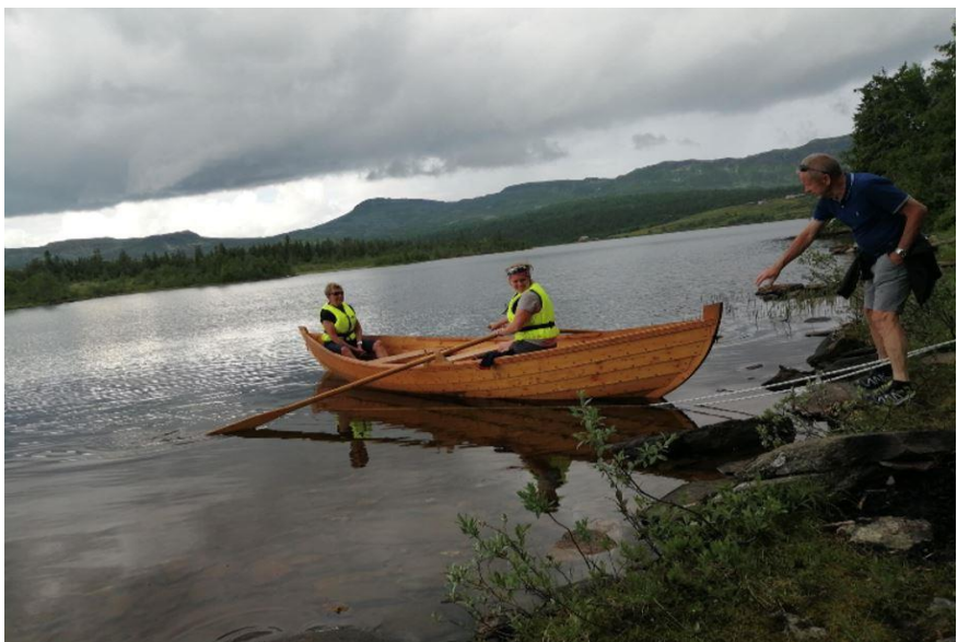
«Ragnfrid» på Sjøsetra.

Membership is open to everyone, and cost 200 kroner for 2021. All members (if we have their email addresses) will receive our Newsletter «Gausdal Tidende» four times a year.