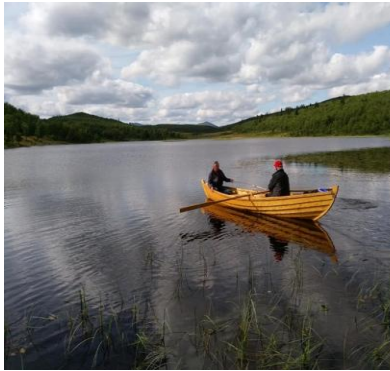
Lauvålibåten på Tortjernet

Lauvålibåt kom på vannet, og den ble plassert på Tortjernet. Dessverre tok det lang tid å få godkjenning av båten, slik at den ikke kom til fjells før tidlig i august. Båten er nå i vinteropplag på låven på Vangum.