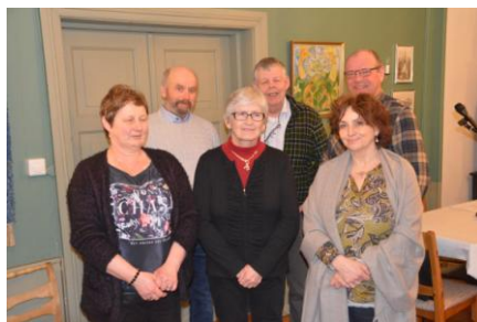
Styret 2016