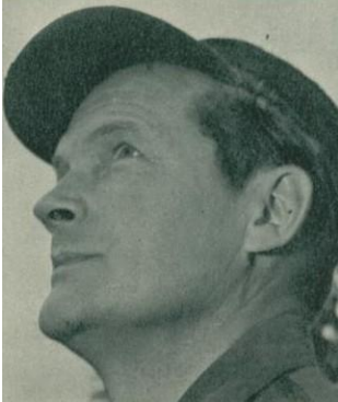
Hans Børli.