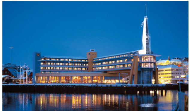
Rica Ishavshotel, Tromsø