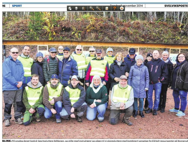
BLINK: På onsdag åpnet Svelvik Sportskyttere feltbanen, og stilte med instruktører og våpen til ni skarpskyttere med kombinert sansetop fra Eikholt ressursenter på Kannerud.

Ni av deltakerne på bildet deltok i skyteøvelser på skytebanen i Svelvik. Det ble nok mange blinker.