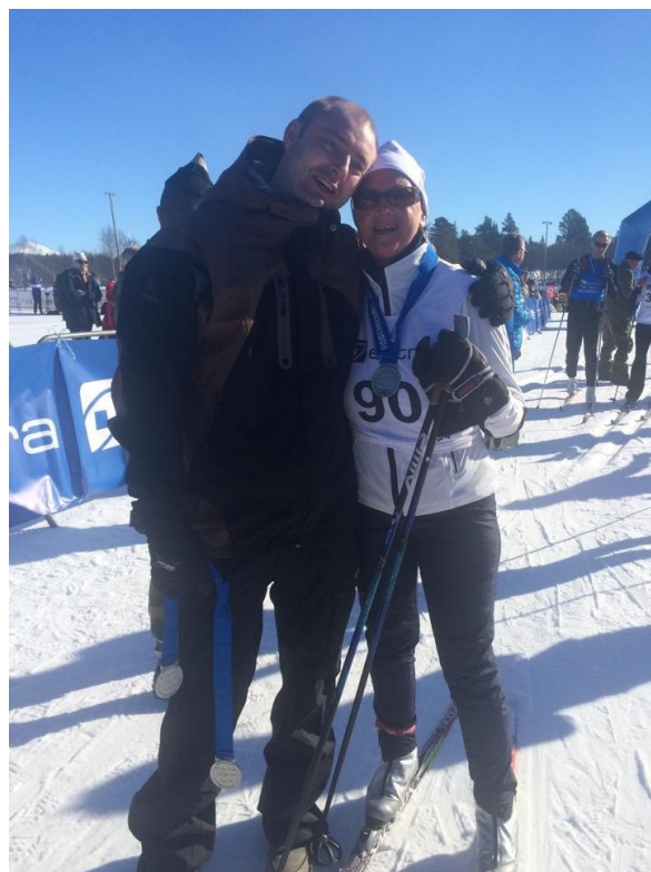
Ved Ridderrennet ble medaljene delt ut av arbeids- og sosialminister Robert Eriksson.