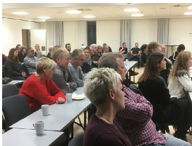
En del av møtedeltakerne

Etter et par timer til fri disposisjon var det tid for å pynte seg til julebordet. Varm gløgg ble servert i lobbyen før vi kunne ta plass ved bordene. Vi hadde en egen sal for oss selv, godt opplyst. Så kunne vi selv forsyne oss av det rikholdige matbordet med god julemat og alskens tilbehør.